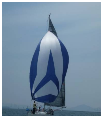
特集明けの今回、Amalfi 艇の写真は小ぶりとなりました。