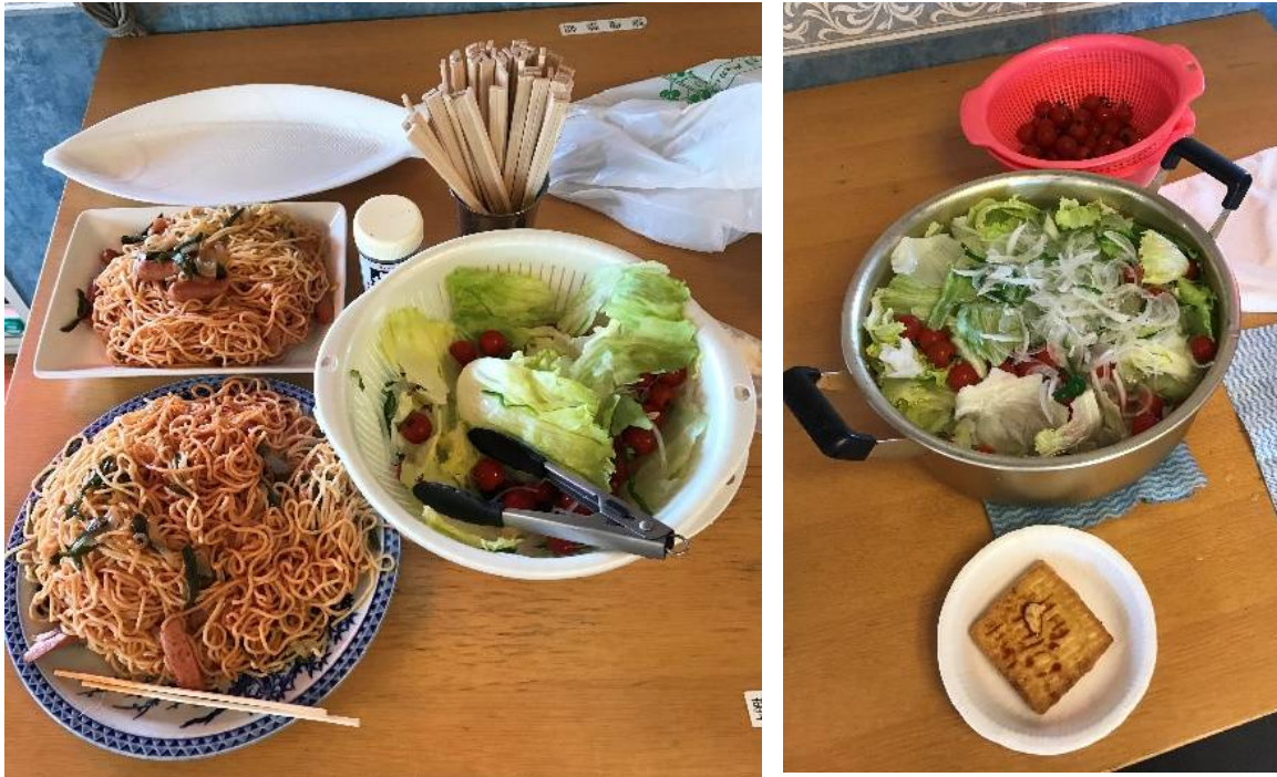
お鍋の使用が北港らしい光景であろうか。

参加メンバーは、レースで余ったエネルギーをパーティーへと注ぎ、いつ果てるとも分からない宴へと没入されていった。その模様は差し障りも考えられるので、料理の一部をご紹介しますことに留めておきたい。